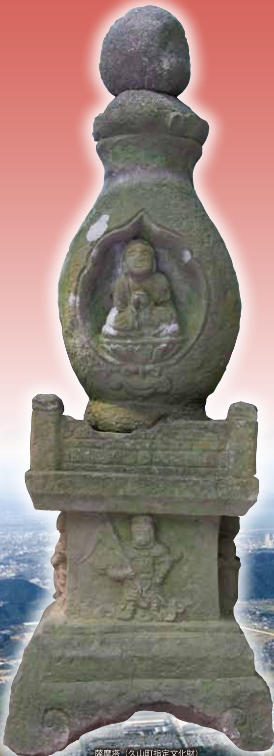
薩摩塔 (久山町指定文化財)

日時 平成25年8月18日(日) 9時30分～16時30分 会場 レスポール久山・ けやき 櫻ホール(福岡県糟屋郡久山町)