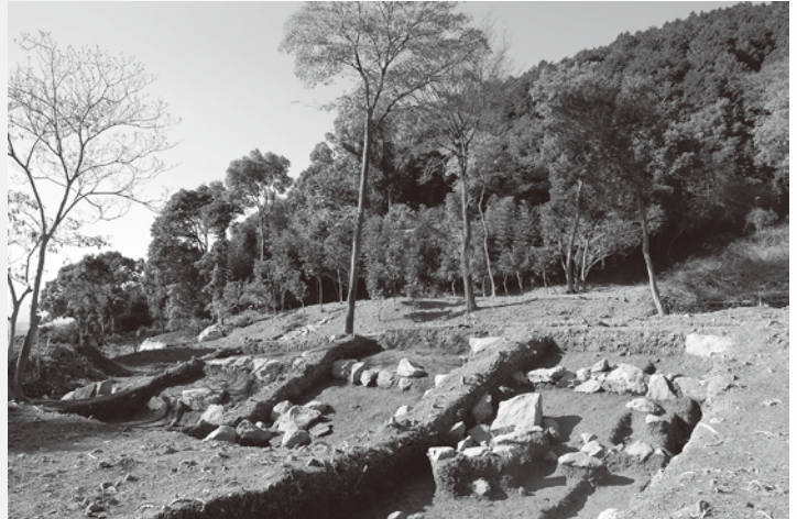
首羅山遺跡本谷地区基壇